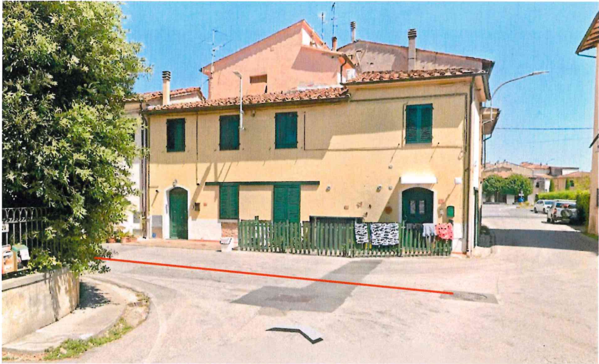
Figure 5: tratto idrico da sostituire via della Chiesa, incrocio con via F. Magellano, Vicopisano