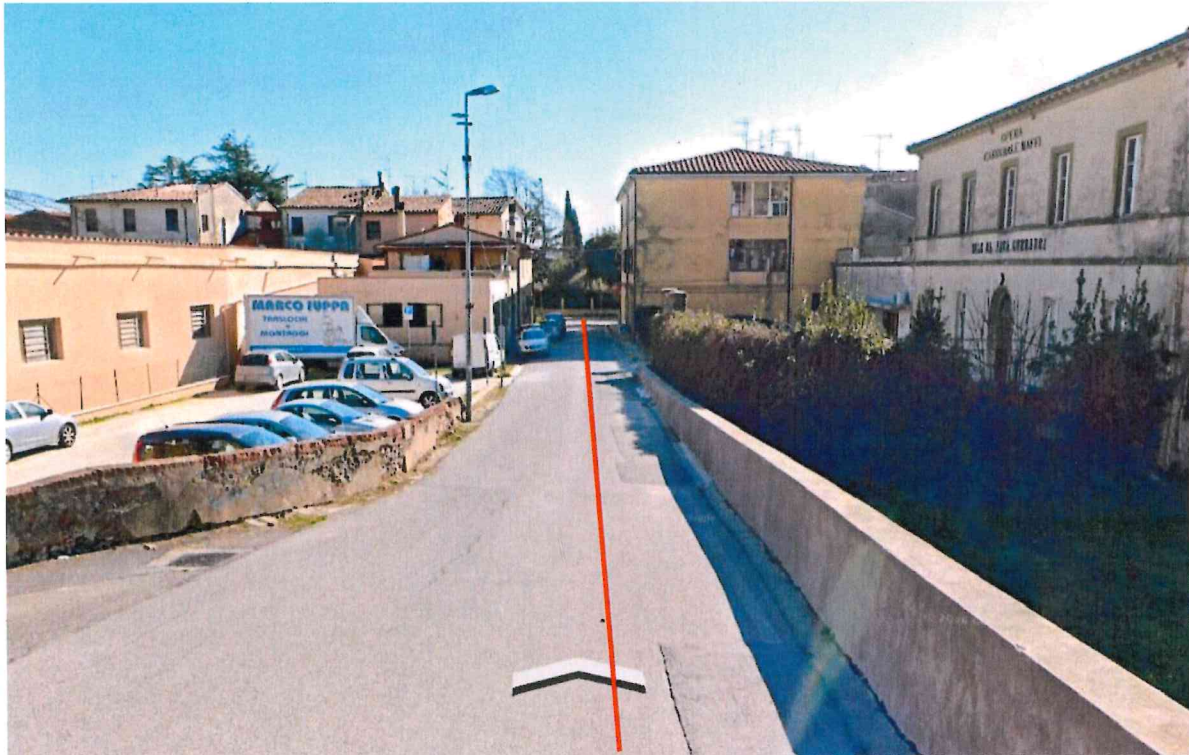
Figure 4: tratto idrico da sostituire via della Chiesa, Vicopisano