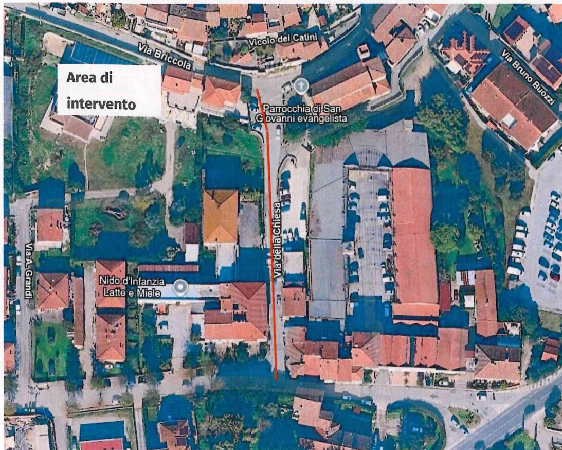
Figura 2: inquadramento generale e localizzazione intervento – via della Chiesa – Vicopisano (tratto in rosso da sostituire)