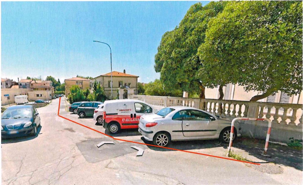
Figura 3: tratto idrico da sostituire via della Chiesa, incrocio con via Briccola – via Armando Diaz, Vicopisano