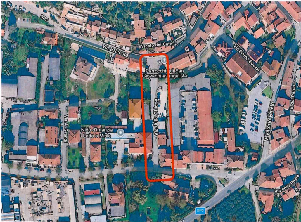
Figura 1: inquadramento territoriale – via della Chiesa – Vicopisano