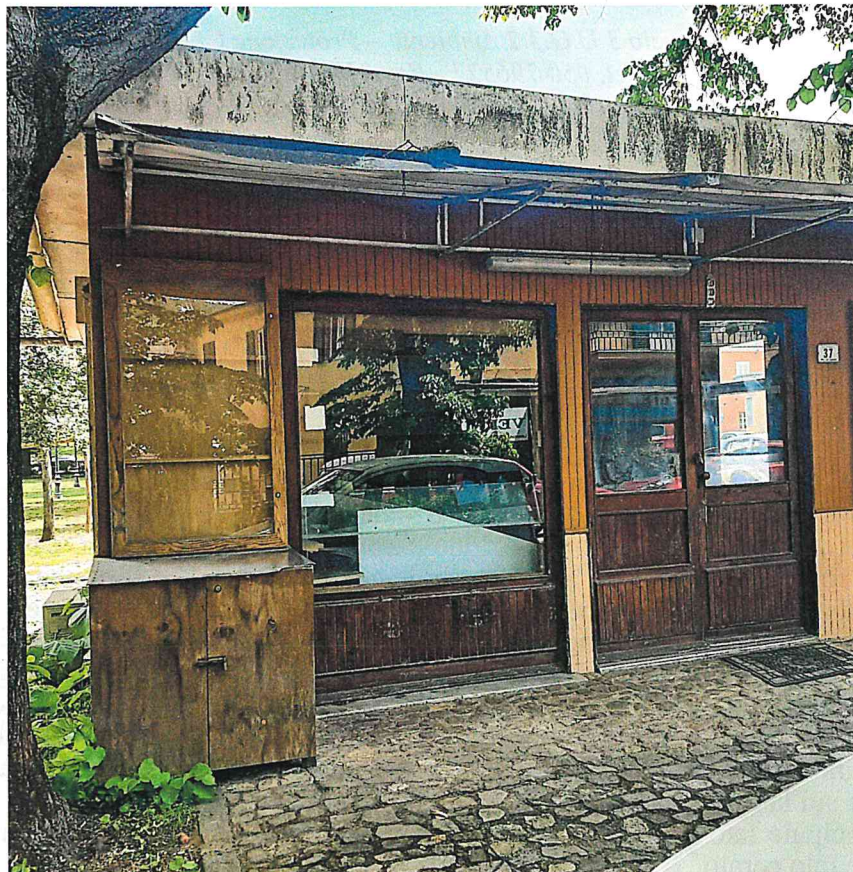
prospetto principale lato Ovest

Si allega documentazione fotografica dello stato di fatto: