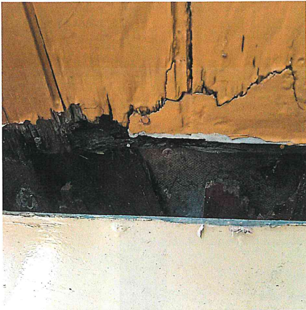
particolare marcescenza pannelli in legno