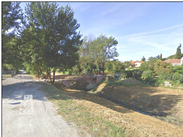
Foto 2 – Vista verso valle del Fosso Serezza Vecchia; in lontananza l'edificio della cateratta di sbocco in Arno.